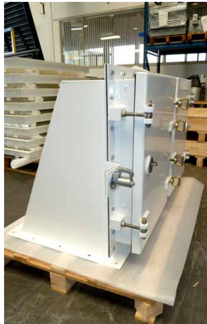
Robotgelaste luchtinlaat schip, voorzien van poedercoating.

Zoals gezegd is Uithoorn sinds 1958 de thuisbasis van Smitsair. Aan de Industrieweg 6 heeft het bedrijf volgens Beerling de laatste vijftien jaar opnieuw mooie stappen gezet. Daarbij zijn de accenten echter verlegd. "Waar voorheen de nadruk lag op montagewerkzaamheden en luchtkanaaltechnische projecten in de utiliteitsbouw richten we ons nu primair op de productie van luchttechni-