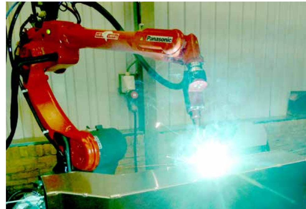
Lasrobot in actie.

sche componenten zoals roosters, kappen en kleppen. Een tweede kernactiviteit is de fabricage van JET-systemen ten behoeve van de luchtdistributie in grote ruimtes. Daarbij moet je onder meer denken aan beursgebouwen, evenementenhallen en distributiecentra. Last but not least bedienen we met klantspecifiek